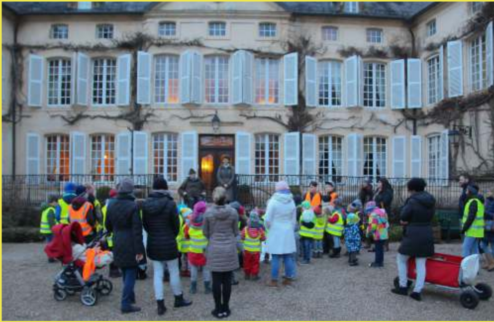
Fotoen: Château de Fischbach Luss Brosius Frank Weyrich