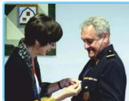
Rol Miny Croix de mérite am Gold (45)