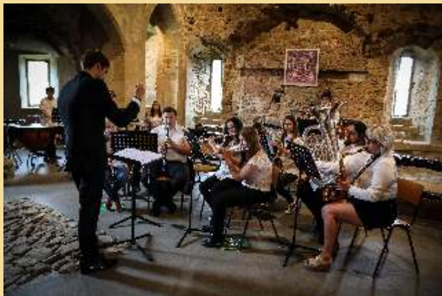
Ensemble Instrumental UGDA vun der Fielser Musek