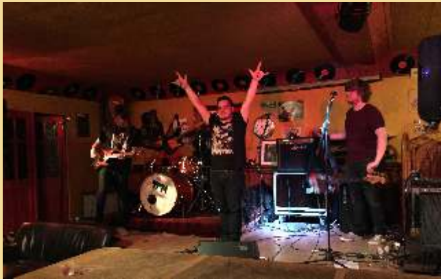
The Pendulum's Motion