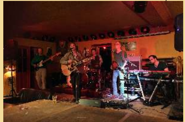
Seed to Tree