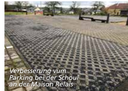
Verbesserung vum Parking bei der Schoul an der Maison Relais