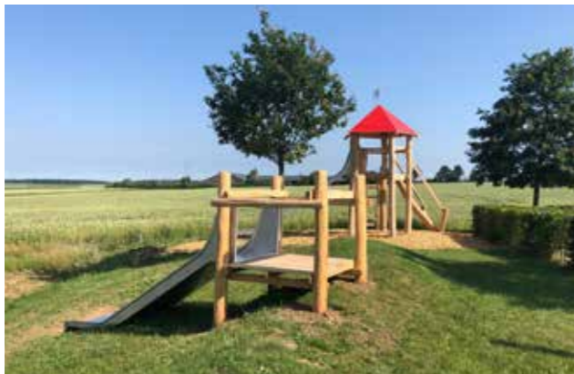
Nei Spillplatz op der Héicht