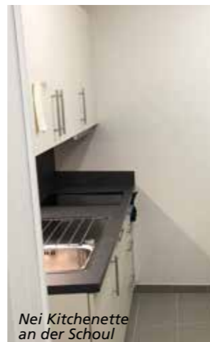
Nei Kitchenette an der Schoul