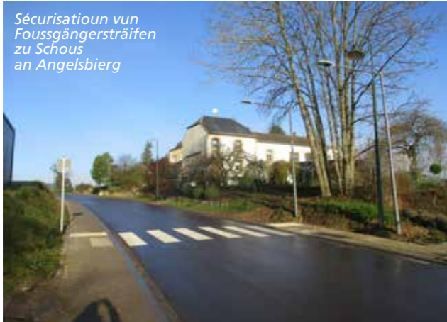
Sécurisatioun vun Foussgängersträifen zu Schoos an Angelsbiereg