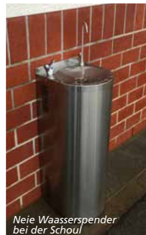
Neie Waasserspender bei der Schoul