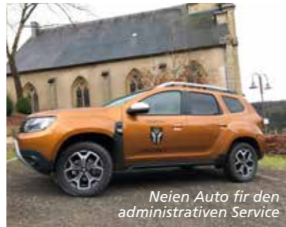
Neien Auto fir den administrativen Service