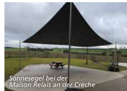
Sonneseigel bei der Maison Relais an der Crèche