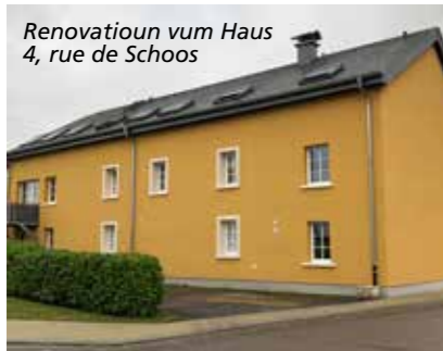
Renovatioun vum Haus 4, rue de Schoos