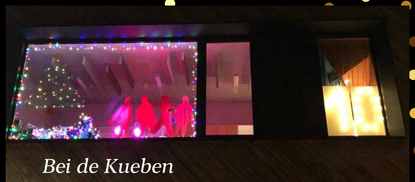
Bei de Kueben