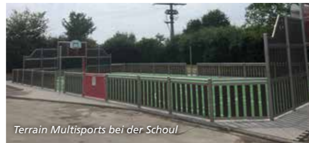
Terrain Multisports bei der Schoul