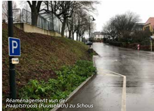
Réaménagement vun der Haaptstrooss (Fuusselach) zu Schoos