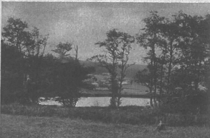
Bild 24. Der unterste der beiden Weiher, welche die Wasserkraft für das Gebläse des im Jahre 1768 erbauten Hochofens lieferten. (Landstrasse Lintgen-Fischbach).

her, welche die Wasserkraft zum Betriebe der Gebläse lieferten, sind noch heute vorhanden; zwischen den Weihern befindet sich ebenfalls noch eine größere Schlackenhalde. Anfänglich wurde das Eisen zur Weiterverarbeitung nach Dommeldingen (Grünwald) verbracht, später wurde jedoch eine Schmiede in Fischbach an der Straße Luxemburg-Fels erbaut. 1812 errichtete der neue Besitzer der Hütte — Charles Joseph Collart — einen zweiten Hochofen an der weißen Erz. Der erste Hochofen (1768) wurde in demselben Jahre abgerissen, 1836 jedoch von dem Nachfolger Collarts — Auguste Garnier — durch einen neuen ersetzt. Beide Oefen waren in Betrieb bis 1842, es folgte eine Unterbrechung bis 1852, wo sie von August Metz gepachtet wurden, welcher sie bis 1857 exploitiert, um sie dann endgültig aufzugeben. In Fischbach wurden Eisenerze aus der Merscher Gegend verhüttet, die Holzkohle stammte aus den umliegenden Wäldern. (Nach Jos. Wagner.)