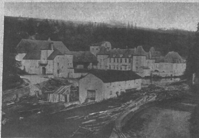
Bild 66. — Das Dommeldinger Schloss (Collart) mit Dependenzien zur Zeit des Hochofenbetriebes im Grünwald.