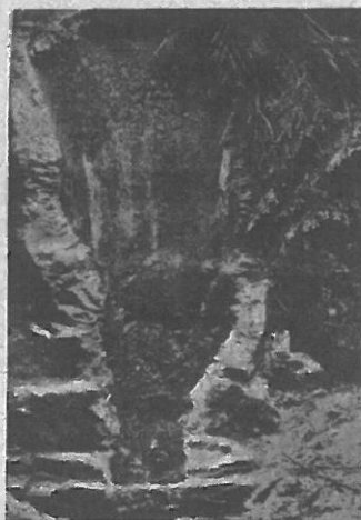
Bild 26. — Die Ueberreste des im Jahre 1812 erbauten Hochofens, dieselben wurden 1916 aufgefunden.