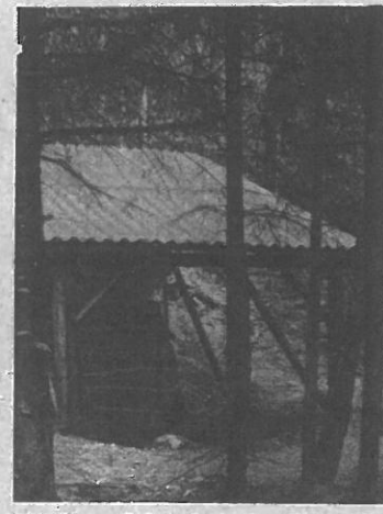
Bild 27. — Schutzdach über dem alten Hochofen von 1812 (Vgl. Bild 26), welches vor kurzer Zeit errichtet wurde, um dieses historische Denkmal vor den Witterungseinflüssen zu schützen.