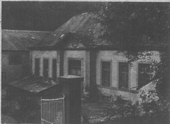
Bild 23. — Teilgebäude der früheren Papierfabrik „Les Rochers“ (Manternach). In diesem Gebäude befand sich ehemals das Spaltwerk (fonderie) der Berburger Schmelz.

her, welche die Wasserkraft zum Betriebe der Gebläse lieferten, sind noch heute vorhanden; zwischen den Weihern befindet sich ebenfalls noch eine größere Schlackenhalde. Anfänglich wurde das Eisen zur Weiterverarbeitung nach Dommeldingen (Grünwald) verbracht, später wurde jedoch eine Schmiede in Fischbach an der Straße Luxemburg-Fels erbaut. 1812 errichtete der neue Besitzer der Hütte — Charles Joseph Collart — einen zweiten Hochofen an der weißen Erz. Der erste Hochofen (1768) wurde in demselben Jahre abgerissen, 1836 jedoch von dem Nachfolger Collarts — Auguste Garnier — durch einen neuen ersetzt. Beide Oefen waren in Betrieb bis 1842, es folgte eine Unterbrechung bis 1852, wo sie von August Metz gepachtet wurden, welcher sie bis 1857 exploitiert, um sie dann endgültig aufzugeben. In Fischbach wurden Eisenerze aus der Merscher Gegend verhüttet, die Holzkohle stammte aus den umliegenden Wäldern. (Nach Jos. Wagner.)